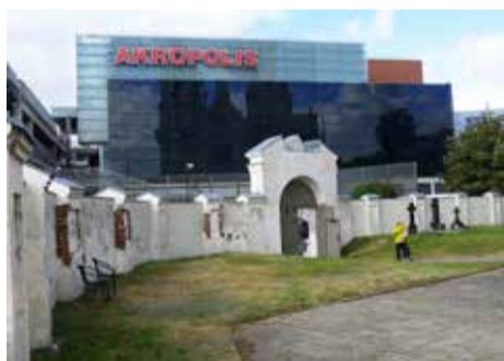
„Akropolio“ automobilių aikštelė ir Kauno Šv. Kryžiaus (karmelitų) bažnyčia: „naujosios architektūros“ fragmentai

Aršiai kovota su religiniais „prietaisais“. Nuimti kryžiai ir statulos nuo Kauno Šv. arkangelo Mykolo ir Kauno evangelikų liuteronų Švč. Trejybės bažnyčių, o, pavyzdžiui, Pasvalio architektui pasirūpinus tinkamesniu bažnyčios šventoriaus aptvėrimu, tas doras