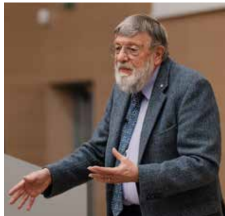
Nobelio premijos laureatas William Danielis Phillips Vilniaus universitete.

Vilniaus universiteto Gyvybės mokslų centro Didžiojoje auditorijoje Merilando universiteto išskirtinis profesorius skaitė žinomą paskaitą „Laikas, Einšteinas ir šalčiausi dalykai Visatoje“ (angl. „Time, Einstein and the Coolest Stuff in the Universe“). „Albertas Einšteinas atrado įvairiausių dalykų, kurie pakeitė mūsų mąstymą apie Visatos prigimtį, ir toliau daro įtaką mokslui ir technologijoms XXI amžiuje. Bet turbūt labiausiai Einšteinas garsėja savo reliatyvumo teorija. Reliatyvumo teorija buvo tokia revoliucinga, kad pakeitė