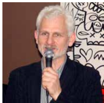
2022-ųjų Nobelio taikos premijos laureatas Alesius Beliackis

„Aš džiaugiuosi, kad Nobelio taikos premija skiriama pripažintoms žmogaus teisių organizacijoms ir kolegoms, su kuriais teko ir tenka dirbti. Premija akcentuoja tiek žmogaus teisių svarbą, tiek nesmurtinio