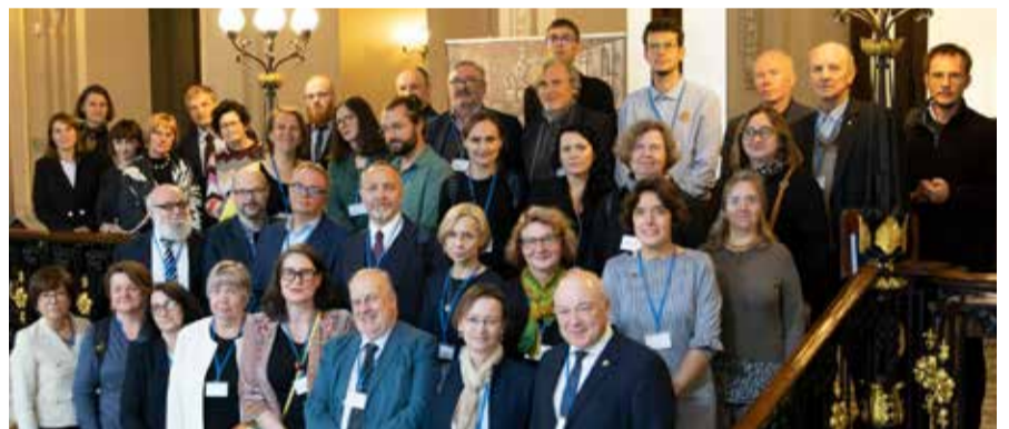
P. Skorinos įkurtos spaustuvės 500 metų jubiliejui skirtos konferencijos dalyviai Lietuvos mokslų akademijoje