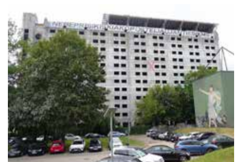
1986 m. pradėtas statyti, bet taip ir nebaigtas viešbutis „Britanika“ – Kauno centro „vaiduoklis“

Ne vienas, berods, lyg ir rimtesnis architektas neatsilaikė prieš pinigų spaudimą, stengdamasis įtikti užsakovui. Pakanka ir dangstančių tokius „bizniukus“. Pavyzdžiui, įžūliai įrodinėta, kad Klaipėdos istorinėje dalyje vietoje buvusių dviaukščių namelių reikiama statyti keliolikos aukštų dangoraižius. Esą taip bus „tobulinamas“ kultūros paveldas, landžiam užsakovui gaunant didžiulį pelną, kurio dalis nubyrės absurdiškų teiginių autoriams. ■