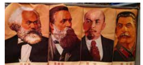
Plakatas su K. Markso, F. Engelso, V. Lenino ir J. Stalino portretais