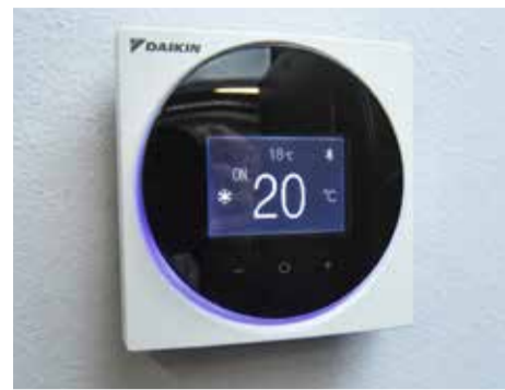
Kondicionieriaus valdymo pultas.