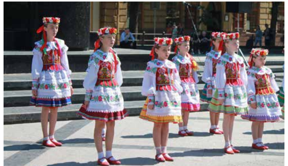
Ukrainiečių kilmės jaunosios šokėjos Kanadoje

Vis dėlto galima išskirti dvi plačias ukrainiečių diasporų rūšis. Mokslininkas pasakoja: „Viena vertus, ukrainiečių valstiečiai emigrovo į kaimiškas vietas, kur toliau gyveno kaip žemdirbiai ir išlaikė didelę dalį tradicinių praktikų bei savo kalbą. Jie paprastai