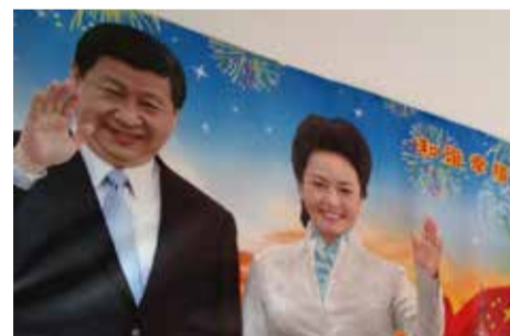
Mao Dzedongas su žmona Dziang Čing (Jiang Qing) – „kultūrinės revoliucijos“ – chunveibinų siautėjimo iniciatorė.

Galima paklausti, kam gi reikia tokio politinio šou, kaip partijos kongresas? Pirmiausia tam, kad net autoritariniams režimams, o šiuo atveju Kinijai, svarbu savo visuomenės pademonstruoti pagarbą procedūroms ir taip puoselėti teisinės valstybės iliuziją. Didele dalimi dėl to KKP kongresai visada yra renginys, apie kurį daug kalbama, naujienomis apie jį užpildomas žiniasklaidos eteris, tai tampa kone svarbiausiu penkmečio įvykiu. Partija tuo pritraukia visos šalies dėmesį, stiprina savo autoritetą, parodo tęstinumą ir