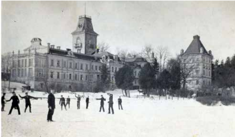
Aukštesniosios kultūrtechnikos mokyklos pastatas (1933 m.)