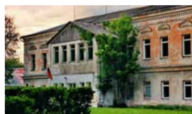
Buivydiškių dvaro nuotrauka

Buivydiškių dvarvietė yra viena seniausių Lietuvoje, minima dar XIII amžiaus kryžiuočių kronikose. 1940 m. dvaras buvo naciona-