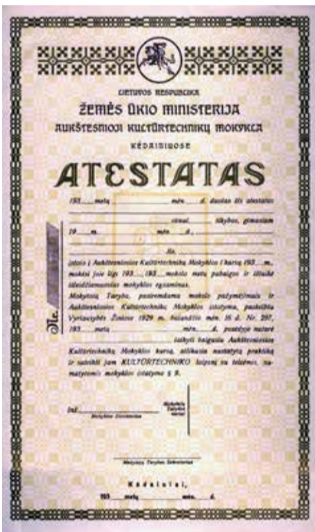
Pirmasis Aukštesniosios kultūrtechnikos mokyklos atestatas

Šių metų spalio mėnesį minimas geodezijos studijų programos, vykdomos Kauno kolegijoje, 95-erių metų jubiliejus. Šios studijų programos ištakos siekia tarpukario Nepriklausomos Lietuvos metus, kai 1927 m. spalio 3 d. Kėdainių dvaro rūmuose įvyko oficialus mokyklos, pavadintos Aukštesniąja kultūrtechnikų mokykla, atidarymas. Pirmoji 29 specialistų kultūrtechnikų laida, kuriems viena iš pagrindinių disciplinų buvo geodezija, išleista 1930 m. Geodezijos specialistų reikšmė besivystančiam respublikos ūkiui sąlygojo geodezijos specialistų ruošimą mokykloje.