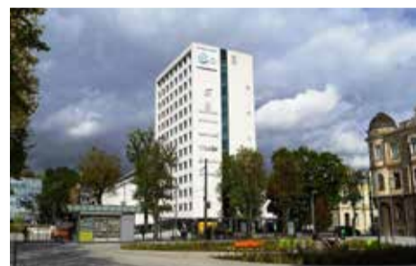
Vienybės aikštė. K. Donelaičio ir S. Daukanto gatvių sankirtoje. Sovietmečiu buvo pervadinta poeto J. Janonio vardu. Daugiaaukščiai pastatai turėjo uždengti bažnyčios bokštus

Pamėginta sovietmečio architektūrą prilyginti tuometinei Vakarų kūrybai, visai neatsižvelgiant į okupacinio režimo ypatybes, totalitarinio režimo gniuždantį politinį, ideologinį ir kitokį poveikį, realaus gyvenimo sovietmečiu sudėtingumą ir t. t. Be abejo, turėtume užjausti anuomet vargusius žmones, bet jau seniai laikas keltis iš pagyrų sovietmečiui liūno.