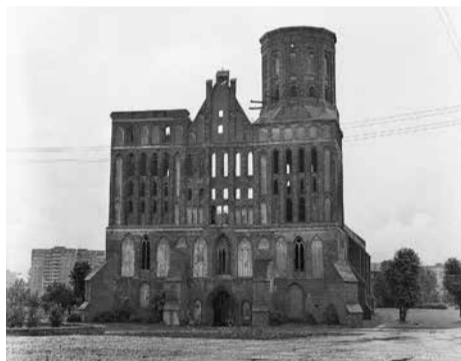
Maldos namų čia niekam nereikia: griuvėsiai primena kažkada buvusią šventovę

Pirmoji kelionė įvyko 1988 m. ir truko dvidešimt dienų. Važiavome trise dviem automobiliais, kiekvieną naktį nakvodavome savo palapinėse vis kitoje vietoje. Visuose didesniuose miestuose mus stabdė milicija arba saugumiečiai ir žiūrėjo, išpūtę akis, į užsienietiškus fotoaparatus bei vaizdo kamerą.