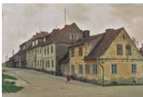
Kažkada čia buvo jauki gatvė