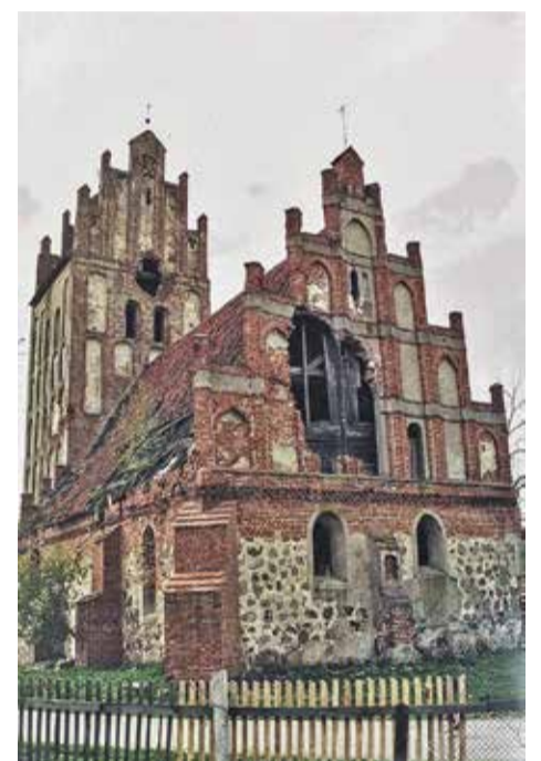
Karo suniokotos šventovės griuvėsiai išstovėjo dar kelias dešimtis metų

Tą pirmą kartą po dvidešimties dienų pervaziavus tiltą, skyrusį Kaliningradą ir Lietuvą, stabtelėjome pirmoje pasitaikiusioje kaimo valgykloje-kavinėje ir pasijutome grįžę į civilizuotą kraštą. O juk tada buvo tik 1988 metai. Štai kas buvo likę iš kitados klestinčio Rytprūsių krašto. Netvarkomos bažnyčios ir kiti pastatai griuvo ne tik dėl