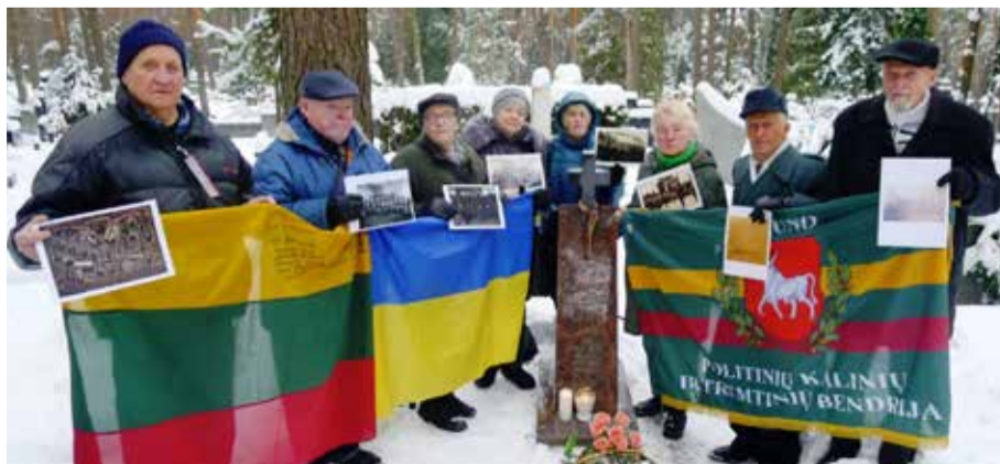
Minėjimo dalyviai Petrašiūnų kapinėse

Š iais metais sukako 80 metų, kai gruodžio 16 d. prof. A. Voldemaras (1883–1942) išsekęs mirė Butyrkų kalėjimo ligoninėje Maskvoje. Ta proga Kauno Petrašiūnų kapinėse prie prof. A. Voldemaro kenotafo įvyko jo 80-ųjų mirties metinių minėjimas, kuriame dalyvavo Lietuvos politinių kalinių ir tremtinių bendrijos ir sąjungos atstovai, šauliai. Lietuvos gyventojų genocido ir rezistencijos tyrimo centro darbuotojas,