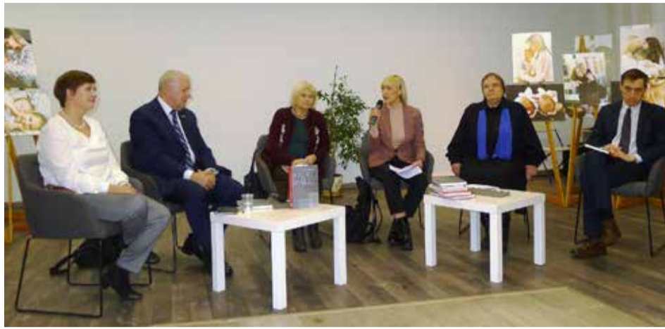
Knygos sutiktuvių dalyviai

Tyrinėjant KGB veiklą, sudėtinga išvengti agentų temos. Ne visi dokumentai yra išlikę, todėl ypač labai sunku kalbėti apie verbavimo mechanizmą. Šią spragą šiek tiek kompensuoja prisipažinusių agentų pasakojimai. Tad belieka, remiantis KGB dokumentais, bandyti atskleisti agentų socialinį portretą, statistinius duomenis ir kokią vietą jie vaidina, įgyvendinant KGB