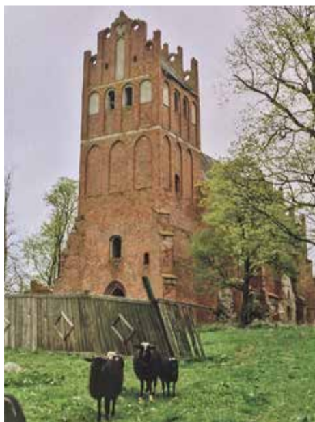
Atvykėliai ir karvės šventovėmis nesidomi