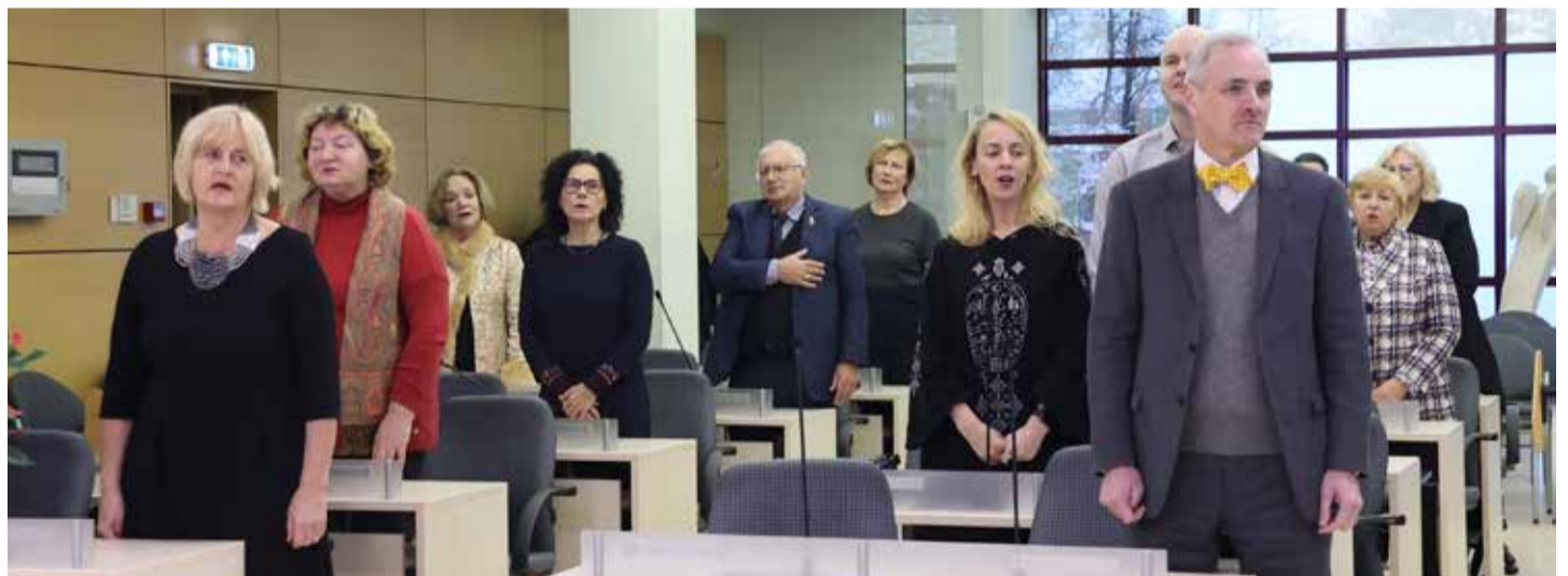
Minėjimo dalyviai giedojo Lietuvos ir Latvijos himnus.

„Baltų centras“ buvo įregistruotas Šiauliuose 2002 m. lapkritį, kaip visuomeninė organizacija, plėtojanti dabartinių baltų tautų – lietuvių ir latvių – kultūrinį bendradarbiavimą. 2004 m. vasarį centras įvardintas kaip asociacija, jungianti mokslininkus ir kultūros veikėjus, pasirengusius vykdyti bendrus projektus, kuriais siekiama geriau pažinti šiuolaikinę baltų kultūrą ir skatinti jos raidą. Steigimo iniciatoriais buvo Šiaulių