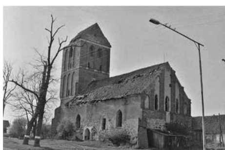
Karaliaučiaus krašto architektūros ženklai

Kelionėje netrūko nei įsimintinių nuotykių, nei netikėtų įvykių. Vienoje vietoje kareivių su automatais buvau „suintas“, nes filmavau vokišką namą, kuris, pasirodo, priklausė pasienio kariniam daliniui. Tąkart, susisiekęs su aukšto rango pulkininku, buvau paleistas. Taip pat pavyko ne tik įvažiuoti, bet net ir filmuoti visiškai sukarintą miestą Baltijską-Pilivą, į kurį norint patekti, net ir vietiniams gyventojams reikėdavo gauti leidimą. Čia dar buvo išlikę 1626 m. švedų pastatytos tvirtovės griuvėsiai.