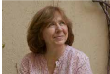
Nobelio literatūros premijos laureatė Svetlana Aleksijevič.

Rugsėjo 21–22 d. „Šetenių skaitymais“ savo viešnagę šalyje pradės Nobelio literatūros premijos laureatė Svetlana Aleksijevič, kuri gimė tame pačiame mieste, kaip ir J. Andruchovyč, Ivano Frankivske. S. Aleksijevič ypač domėjosi ir rašė apie dramatiškus sovietmečio įvykius ir savosios kartos patirtis – karą Afganistane, Sovietų Sąjungos griūtį, Černobylio katastrofą ir jos padarinius, o pastaraisiais metais išgarsėjo kaip aktyvi Baltarusijos diktatūrinio režimo kritikė. 2000-aisiais dėl politinio persekiojimo