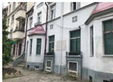
Namas, ant kurio kabėjo filosofo atminimo lenta