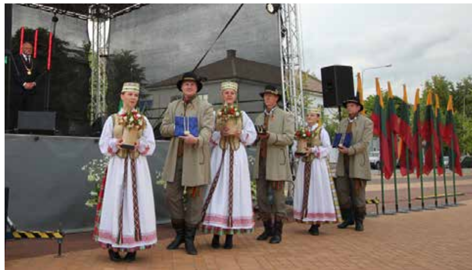
Įnešamos Pakruojo krašto garbės piliečių regalias

pamatomos, tačiau jos yra ir bus valstybės ir visuomenės statinio pamatas. Šie pamatai skirti mūsų vaikams ir vaikaičiams, ant jų bus statomas ateities pasaulis ir Lietuva.“