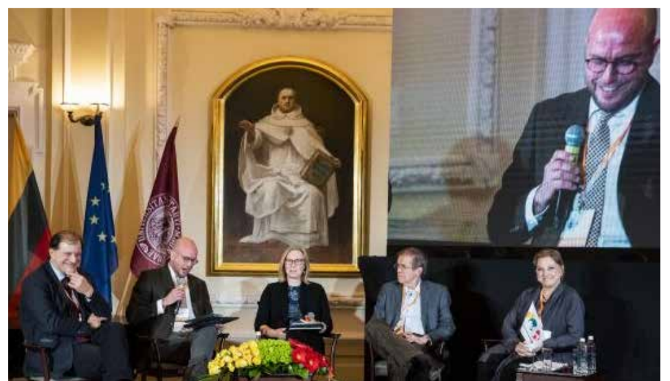
Rengiamasi VDU Pasaulio lietuvių universiteto simpoziumui.

➤ Žiūrovams, dalyvaujantiems per „Zoom“ platformą, – iki spalio 26 d. ■