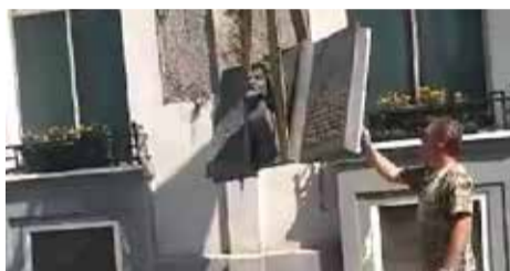
Plėšiama Vydūno atminimo lenta

Atminimo lenta buvo gerai pritvirtinta, todėl pirmosios jos nuimti atsiųstų darbininkų pastangos buvo nesėkmingos. Lenta nuplėšta ekskavatoriaus kaušu. Namo siena buvo gerokai apgadinta, todėl ją teko remontuoti. Valdžios atstovai šį poelgį teisingai vertina, kad jie