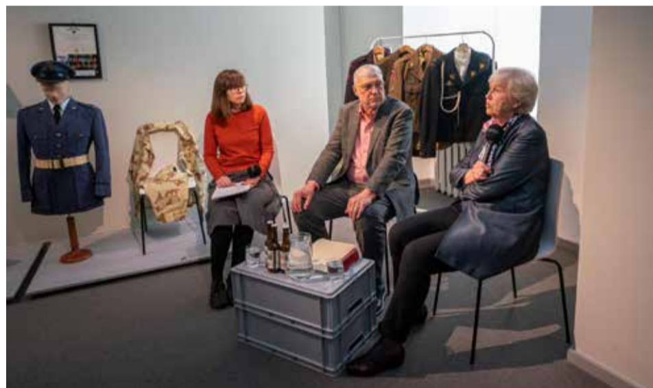
Pokalbis apie karą ir priverstinę emigraciją.