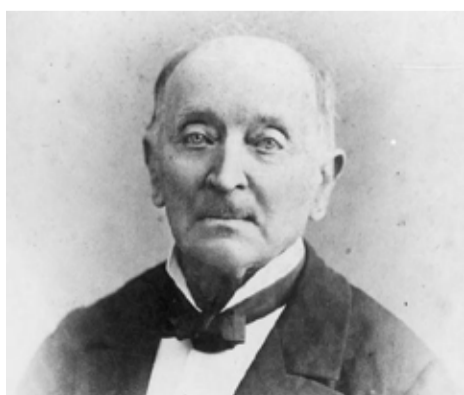
Ignotas Domeika (1802–1889)

Konferencija skirta iškilaus mokslininko, 1830 m. lapkričio sukilimo dalyvio, Vilniaus universiteto ir Parvyžiaus Kalnakasybos aukštosios mokyklos studento, Čilės universiteto Santjago rektoriaus, žymaus geologo, mineralogo ir etnologo 220-osioms gimimo metinėms paminėti. Konferencija apims mokslinių pranešimų pristatymus ir teminę parodą „Pažvelk į mineralą, vis dar bevardį...“.