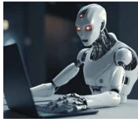
Dirbtinio intelekto įvaizdis. Asoc. nuotr.

„Per greitas ir per griežtas reguliavimas gali paversti tą valstybę ar regioną mažiau konkurencingu už kitus, kur to reguliavimo mažiau arba nėra visai, nes jis gali sulėtinti ar iš viso uždrausti tam tikrų technologijų vystymą, panaudojimą ir panašiai. Tačiau