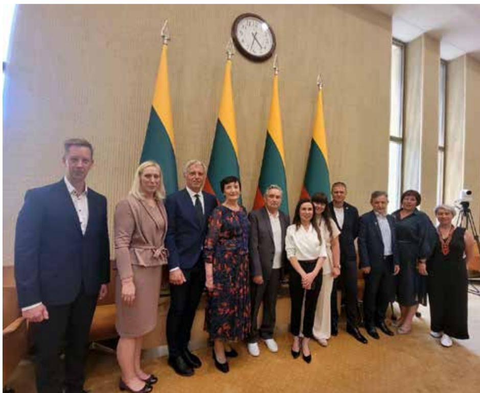
Grupė suvažiavime išrinktos LMS tarybos narių