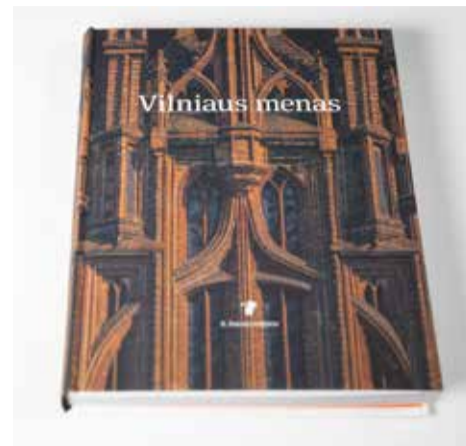
Mikalojus Vorobjovas „Vilniaus menas“ (3-iasis patais. leid. Vilnius: R. Paknio leidykla, 2023 m.)

Sovietinės okupacijos metu buvo leista nemažai albumų, kuriais siekta paslėpti laisvą ir didingą Vilnių, rodyti jį kitokį – tarybinį. Tačiau sunkiai sekėsi dirbtinai išstumti šimtmečių istoriją menančius mūrus, gatvių vingius. Ir sovietiniuose albumuose rasime