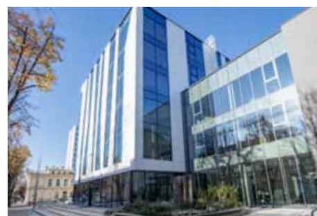
VDU Pedagogų rengimo centras Kaune

Didžiausią šuolį reitinge VDU atliko pagal studentų ir darbuotojų santykį, užimdamas 410 vietą pasaulyje ir pakildamas net 200 pozicijų (pernai universitetui buvo skirta 601+ vieta). Pagal darbdavių atsiliepimus apie universitetą ir jo absolventus, VDU