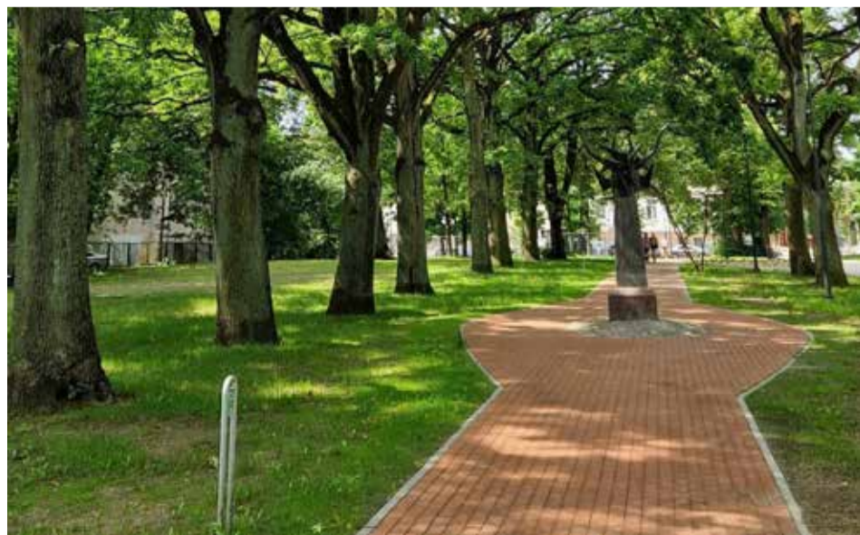
Atnaujintas Klaipėdos skulptūrų parkas - sovietmečiu sunaikintos senosios miesto kapinės