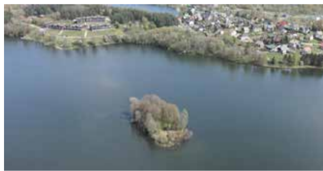
Lietuvos kraštovaizdis. Asoc. nuotrauka

Projekto rezultatus bus galima rasti geoduomenų bazėje, baigiamąjoje ataskaitoje ir mokslinėse publikacijose. Projekto pradžioje buvo surengtas suinteresuotųjų šalių susitikimas,