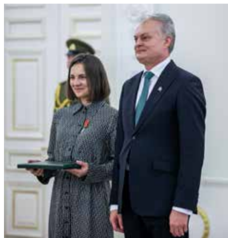
Apdovanojimo Prezidentūroje metu

Prisimindama savo karjeros kelio pradžią, „Kaunas 2022“ programos vadovė sakė, kad dar studijuodama suprato, jog sprendimas rinktis menotyros studijas buvo sėkmingas: „Menotyros studijos yra labai daug savyje talpinančios. Jų metu mokėmės ne tik apie meną, bet ir studijavome istoriją plačiaja prasme. Baigus mokslus, sėkminga banga nunešė