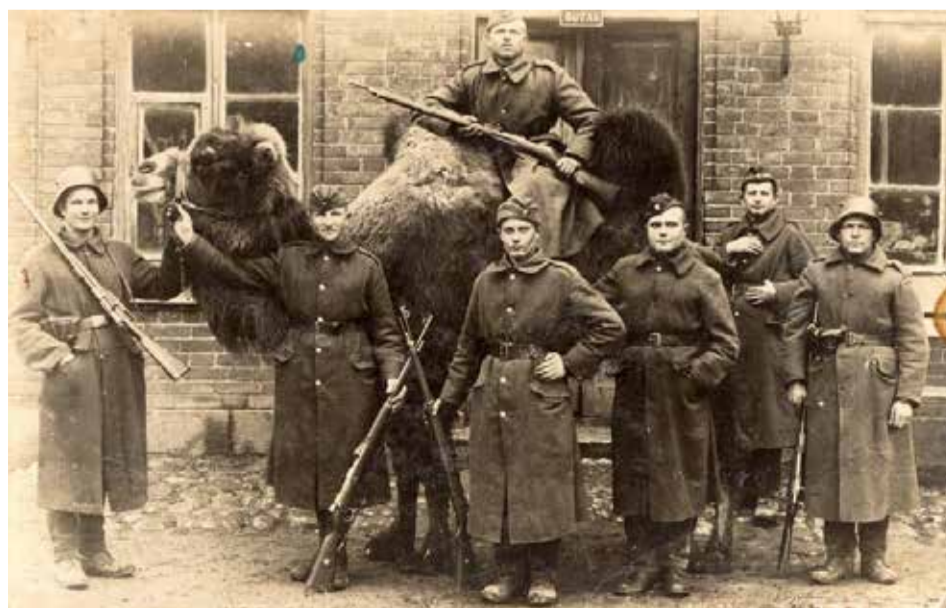
Lietuvos kariuomenės pėstininkai su iš bolševikų atimtu kupranugariumi, Veterinarijos tarnyba. Šančiai, Kaunas 1919 m.