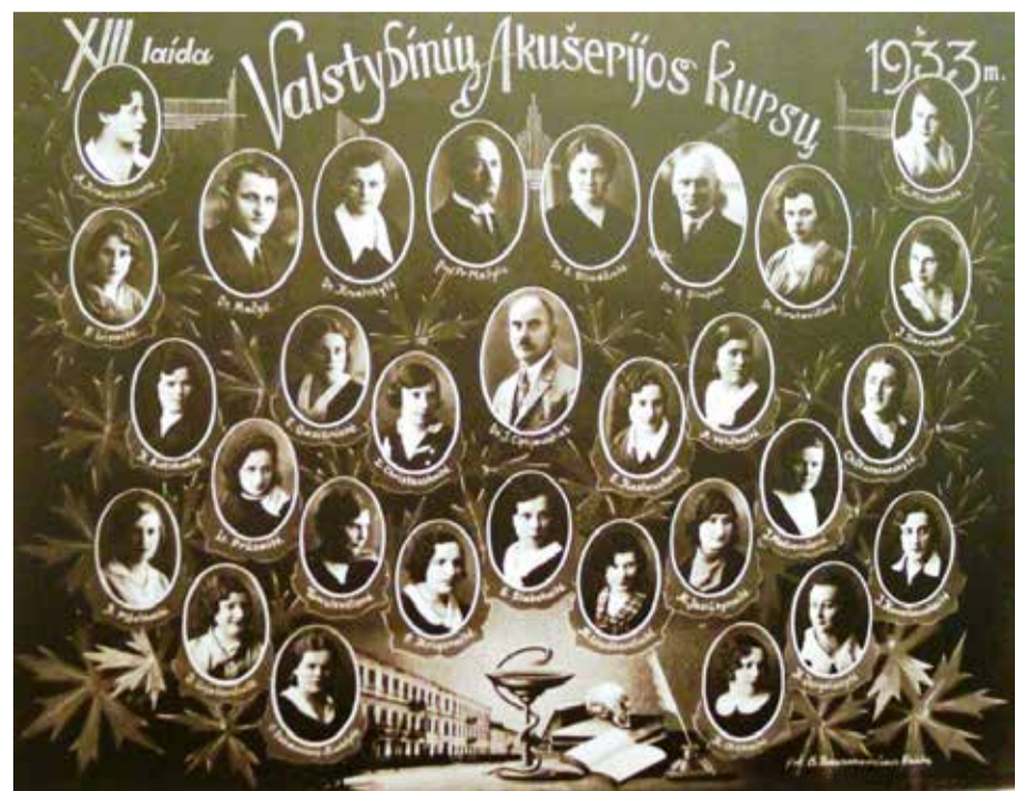
1933 metų valstybinių akušerijos kursų vinjetė