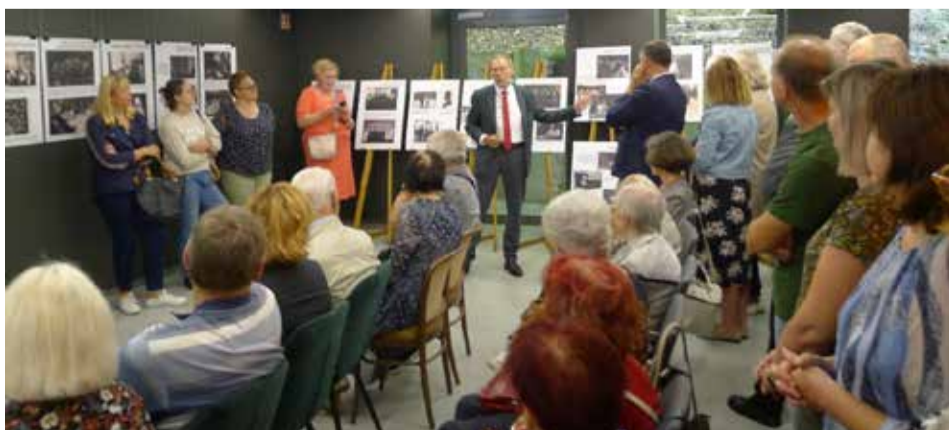
Pirmieji lankytojai susipažįsta su parodos eksponatais

P. Mažylis mirė 1966 m. vasario 28 d. Palaidotas Kaune, Petrašiūnų kapinėse. Po mirties, 1993 m., minint žydų genocido Lietuvoje 50-metį, apdovanotas Žūvančiųjų gelbėjimo kryžiumi.