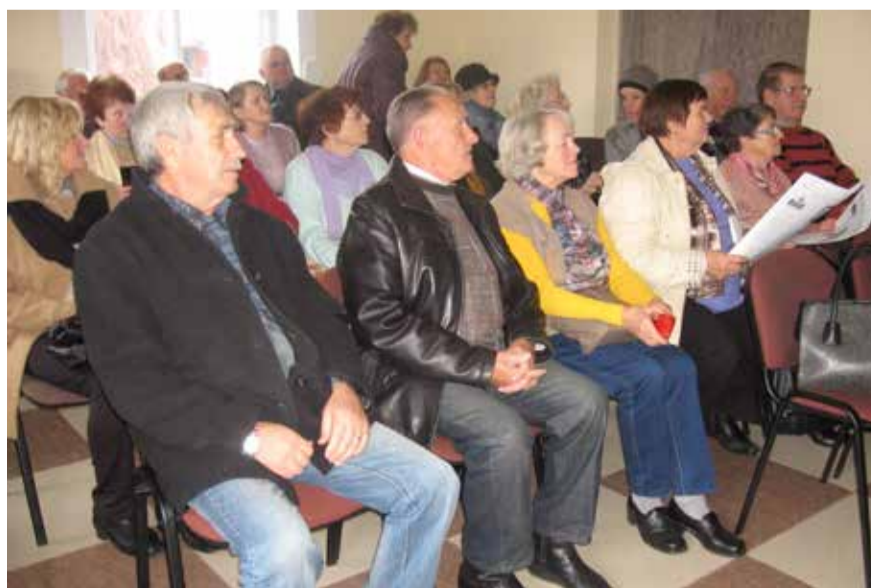
Trečiojo amžiaus universitetas. N. Akmenė.

Darbo kodekse yra numatytos garantijos darbuotojams, kuriems iki pensinio amžiaus liko vos keleri metai. Darbdavys, norėdamas šiuos darbuotojus atleisti iš darbo darbdavio iniciatyva be darbuotojo kaltės, išpėjimą apie sutarties nutraukimą turi pateikti gerokai anksčiau. Išpėjimo terminai dvigubinami darbuotojams, kuriems iki įstatymų nusta-