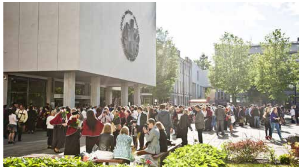
Šventė Vytauto Didžiojo universitete.

Studijų ir mokslo bei meno veiklai buvo skirtas labai geras įvertinimas. Universitetas siūlo lanksčias, dinamiškas studijas, remiantis liberaliųjų menų tradicijomis, leidžiant studentams individualiai derinti savo studijas. Šis studijų lankstumas išskiria VDU iš kitų institucijų ne tik Lietuvoje. Ekspertų išvadoje nurodyta, kad VDU siūlo puikias tarptautines galimybes studentams, dėstytojams, mokslininkams ir darbuotojams,