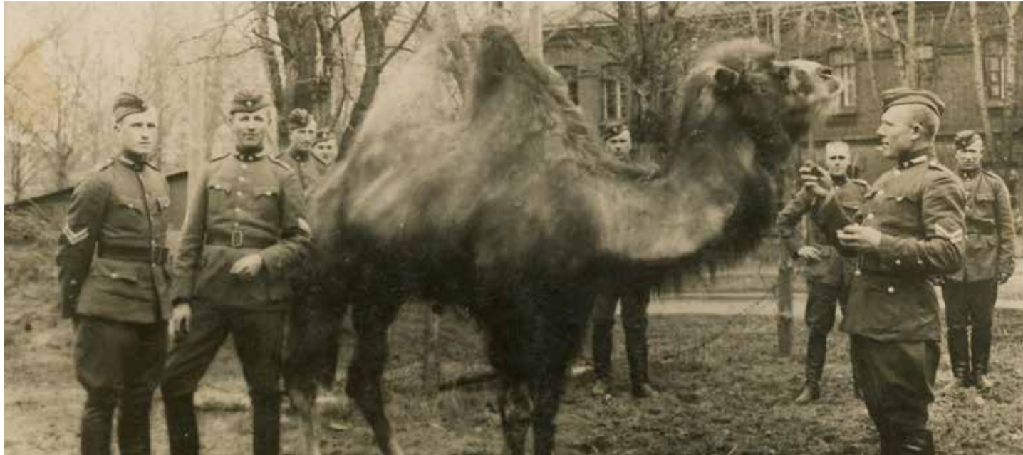
Lietuvos kariuomenės pėstininkai su dvikupriu kupranugariu